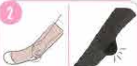
2 かかとの部分を内側から軽くつまみます