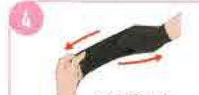
4 つまんだかかと部分まで裏返します