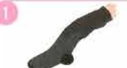
1 stockings の中に手を入れます