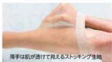
薄手は肌が透けて見える stockings 生地