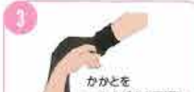
3 かかとをつまんだまま裏返し、ひっくり返します